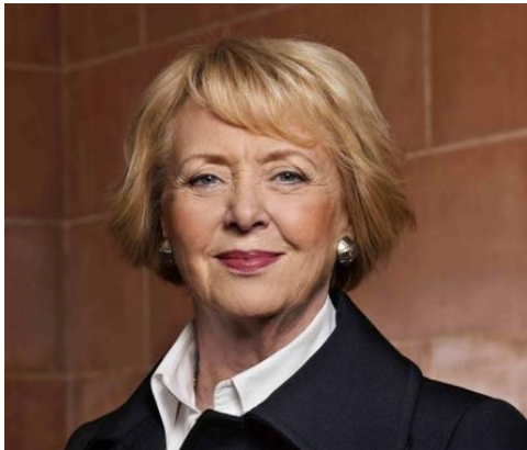
Вігдіс Фіннбоґадоттір Президентка Ісландії (1980 – 1996), перша жінка у світі, яка була демократично обрана на посаду Президента

Мережа була заснована у 1996 році трьома жінками-лідерками