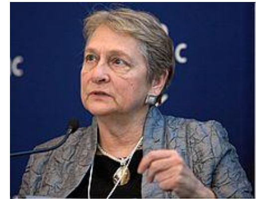
Лаура Лісвуд активістка, Виконавчий директор та Президент Американського товариства навчання та розвитку