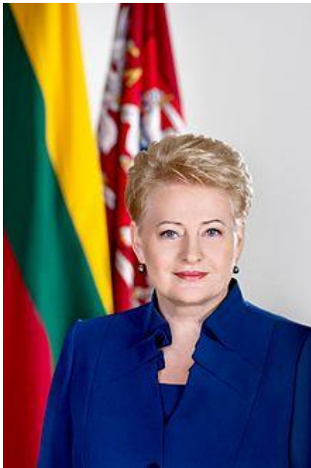
Президент Литви Даля Ґрібаускайте – Голова Ради