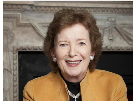
Мері Робінсон Президентка Ірландії (1990 – 1997)