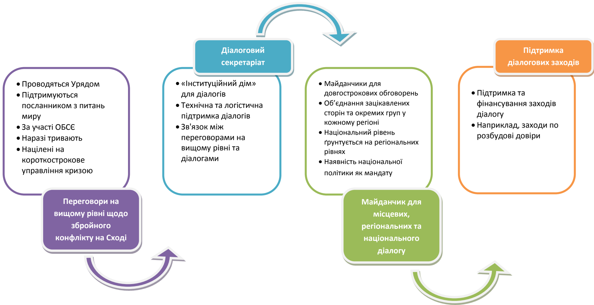
Діаграма 1 – Взаємозв'язок діалогів та функцій