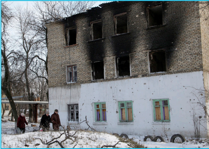
Остаточного тексту Закону й досі не оприлюднено

Наступного ж дня після прийняття закону (19 січня) народні депутати від “Опозиційного блоку” заблокували підписання закону, зареєструвавши проект постанови про скасування рішення Ради, яким був ухвалений Закон. Згідно з регламентом парламенту, голова Ради не має права підписувати законопроект до розгляду проекту постанови про його скасування. Таким чином, доля Закону поки що зависла в повітрі.