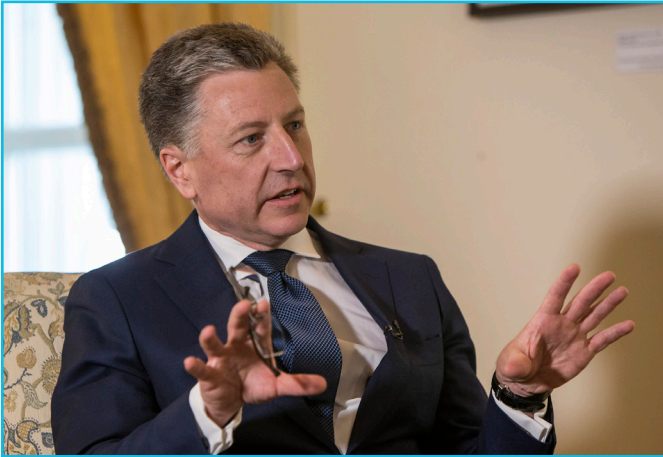
Владиславом Сурковим та українським керівництвом.