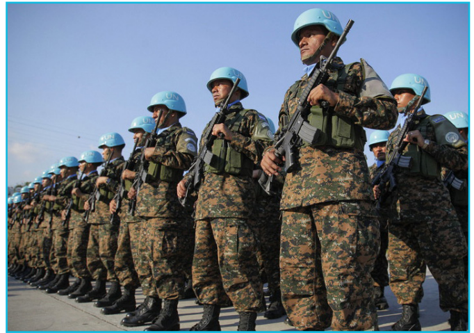
Путін висунув миротворчу пропозицію, щоб запобігти негативному сценарію для Росії.

Неочікувана ініціатива Путіна може бути зумовлена кількома нещодавніми подіями в Україні та світі. По-перше, миротворча ініціатива Путіна спрямована, серед іншого, на те, щоб не допустити надання США летальної зброї Україні. По-друге, миротворча ініціатива Кремля з'явилася після розробки законопроекту України «Про особливості державної політики з відновлення державного суверенітету України над тимчасово окупованою територією Донецької і Луганської областей України» (відомого як законопроект про реінтеграцію Донбасі), де на законодавчому рівні Росія визнається державою-агресором у зв'язку з подіями на сході країни. По-третє, представляючи проект резолюції РБ ООН щодо миротворчої місії на Донбасі, Росія прагне продемонструвати зацікавленість у поліпшенні відносин із Заходом, особливо після прийняття нових санкцій США. По-четверте, миротворча ініціатива Путіна покликана переконати США в тому, що Росія може бути конструктивним і рівноправним партнером США у вирішенні глобальних проблем безпеки, зокрема після досягнення угоди з США та Йорданією про «зону деескалації» на півдні Сирії та підтримки нових санкцій проти КНДР у РБ ООН.